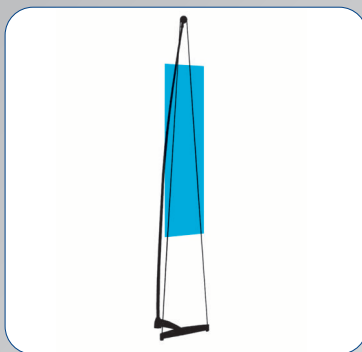
ChronoExpo 2 Staffelei